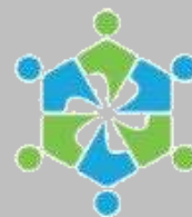
KOPERASI ACALAPATI TIRTA ABHIPRAYA