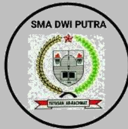
SMA DWI PUTRA