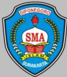
SMA ISLAM DIPONEGORO SURAKARTA