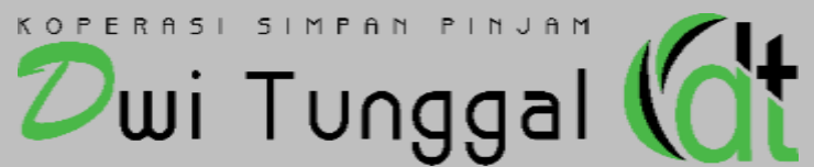
KOPERASI SIMPAN PINJAM